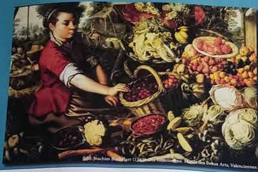
Bild: Joachim Beuckeler (1565) in: Cronache aus Mailand des Debux Arts, Valenciennes.